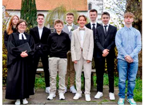
29.04.2023 ADELBY, hinten v. links n. rechts: