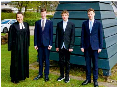
07.05.2023 ENGELSBY, von links nach rechts: