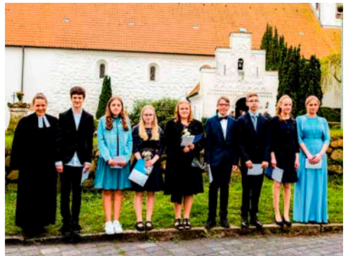
06.05.2023 ENGELSBY, von links nach rechts: