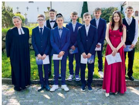
13.05.2023 ADELBY, von links nach rechts: