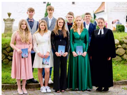
14.05.2023 ADELBY, von links nach rechts: